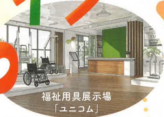
福祉用具展示場 「ユニコム」